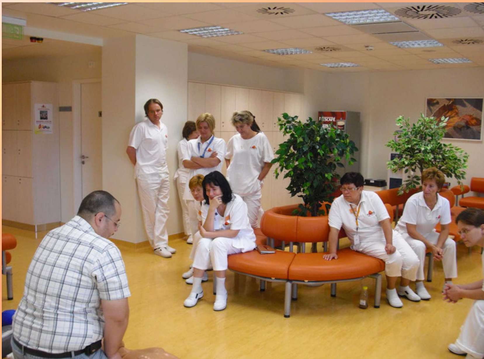
A személyzet rendszeres oktatáson vesz részt