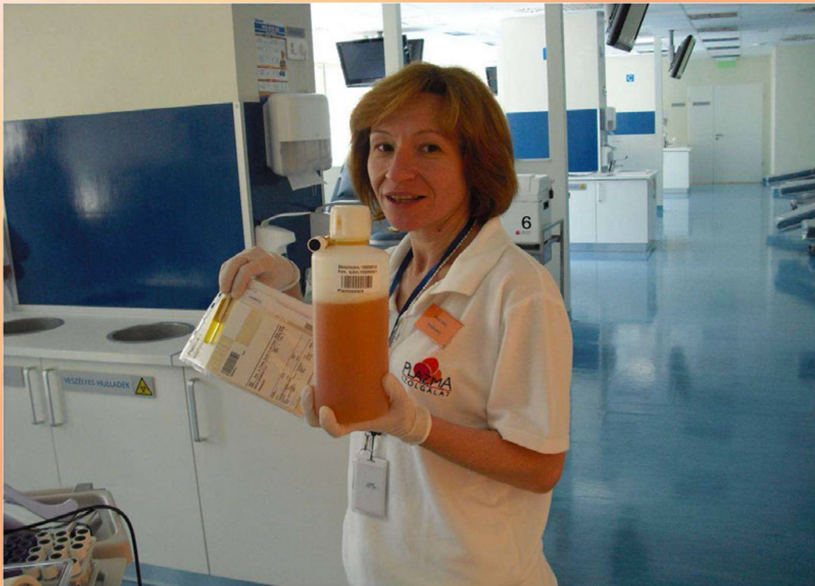
A levett plazmaegység