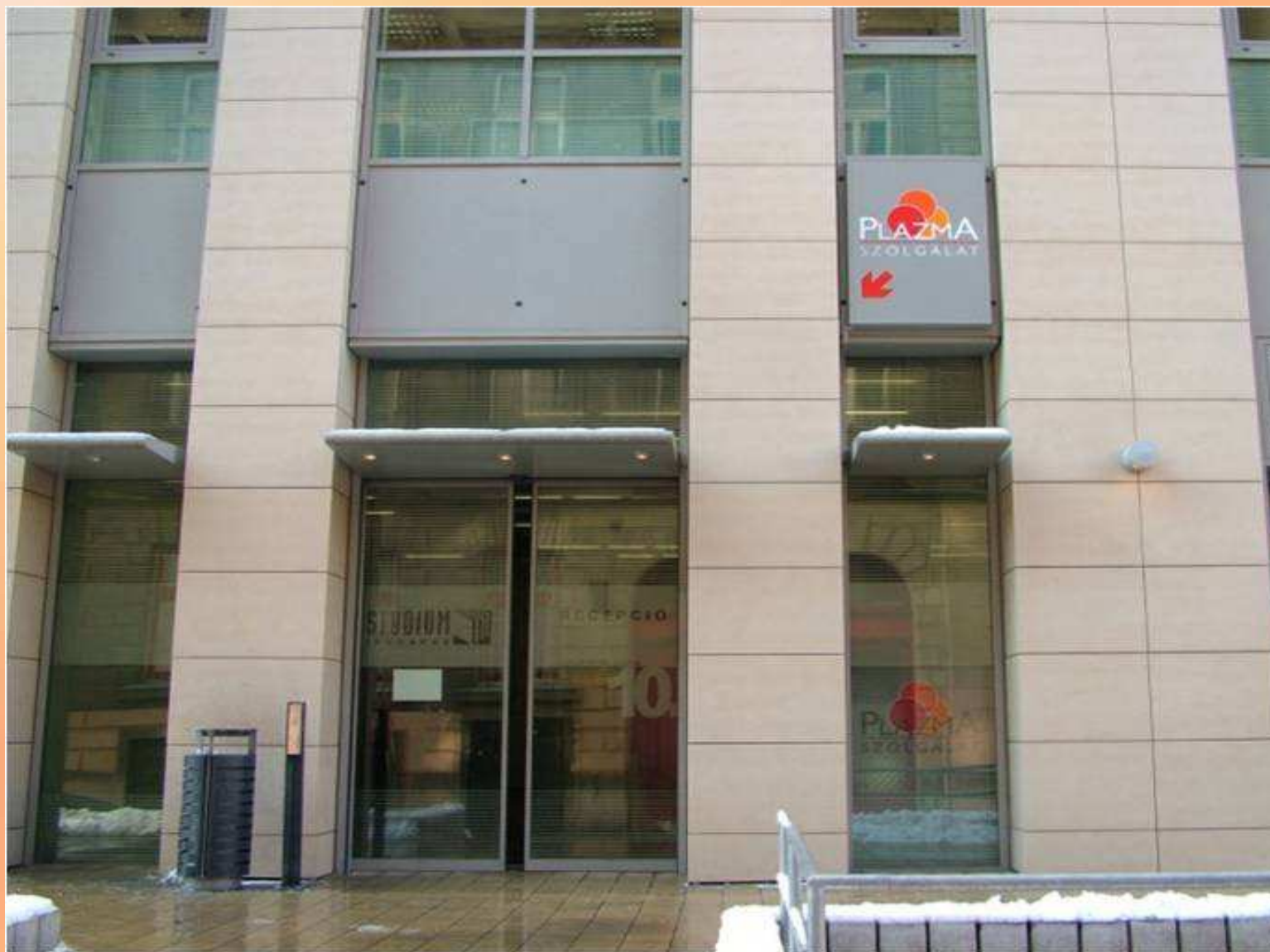
A plazmacentrum bejárata